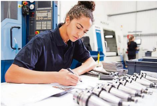
Junge Auszubildende können bei der Messe in Neubiberg vielleicht ganz schnell ihren Traumberuf finden.

Berufsleben stellen können oder gleich einen Ausbildungsvertrag auf der Messe abschließen. „Das ist schon oft gelungen“, sagt Svoboda und verrät, dass man weitere Informationen und den Zeitplan unter www.clever-azubi.com findet. Der Eintritt ist frei, alle Informationen rund um das Thema finden sich im Internet unter www.clever-azubi.com