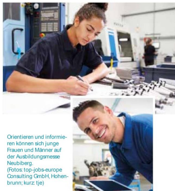
Orientieren und informieren können sich junge Frauen und Männer auf der Ausbildungsmesse Neubi Berg.

Weitere Informationen unter www.clever-azubi.com .